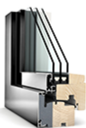
Nízkoenergetická okna VEKRA s titanovým kováním, mikroventilací a 5-ti komorovým profilem